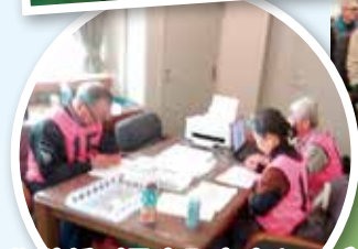
集計係(邑南町老人クラブ 連合会会員の皆さん)