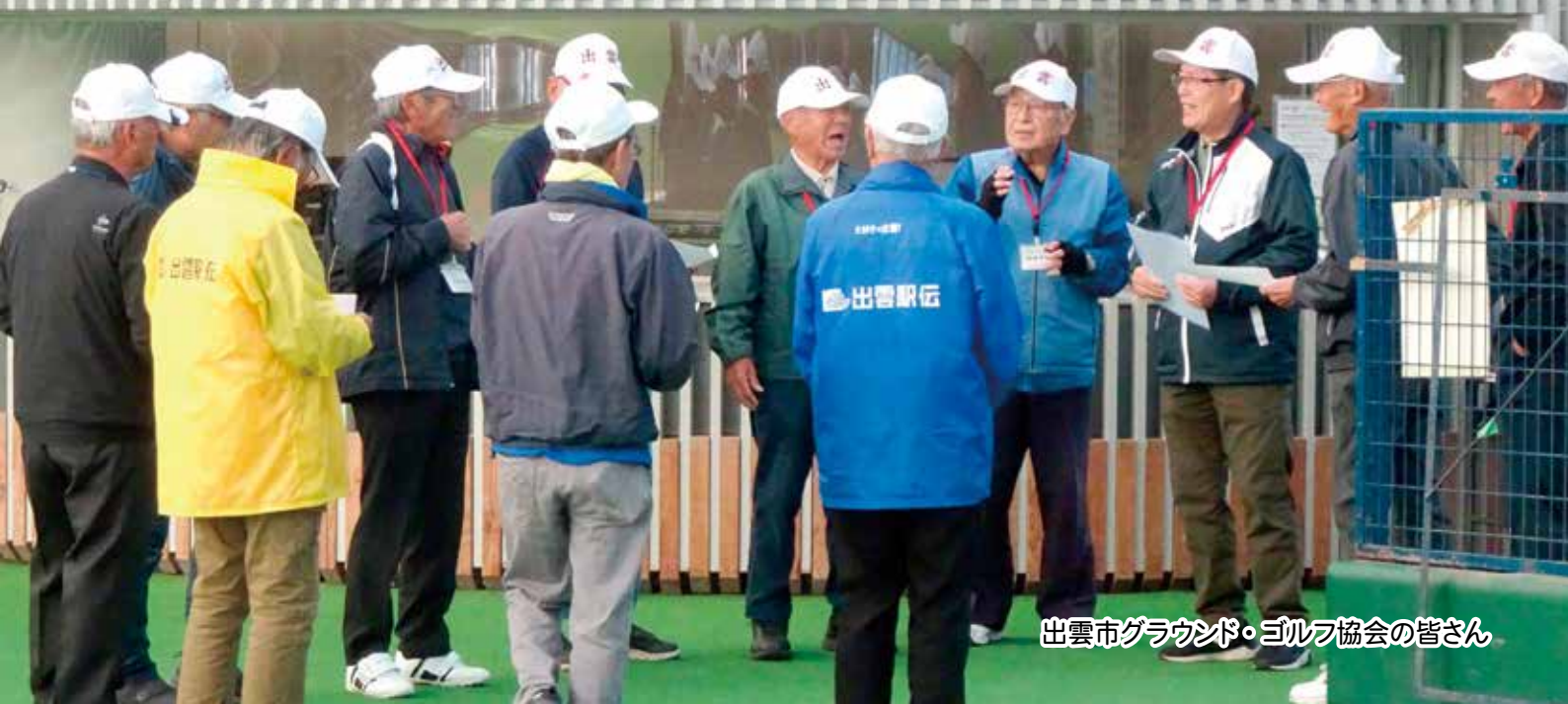
出雲市グラウンド・ゴルフ協会の皆さん