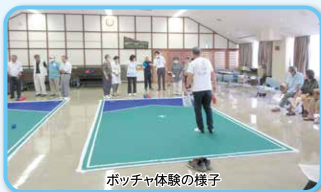
ボッチャ体験の様子

喜一憂し、会場は大盛り上がり。スポーツを通じて会員同士の親睦を深め、笑顔の絶えない賑やかな交流のひとつとなりました。