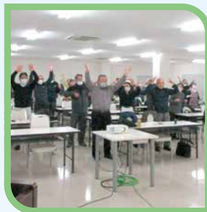
いきいきクラブ体操（東部会場）

今年度の「健康づくり推進員養成研修会」を県内3会場で開催しました。隠岐会場（11月26日／西ノ島町・県島前集合庁舎）、東部会場（12月4日／出雲市・朱鷺会館）、西部会場（12月17日／江津市総合市民センター）に、各市町村から会員・会員外あわせて106名が参加されました。