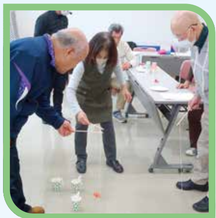
実技の様子（隠岐会場）