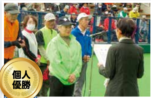
(松江いきいきクラブ ゴールデンエイジたまゆB/松江市)