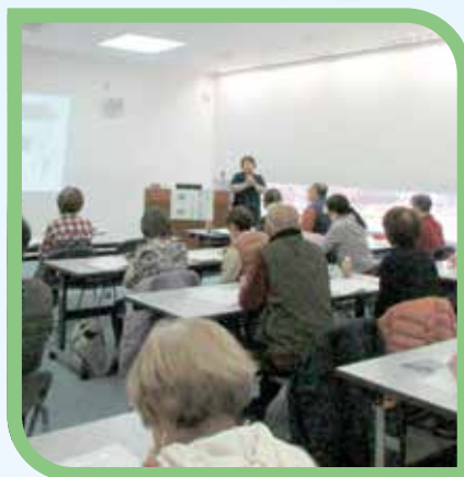
講義の様子（西部会場）