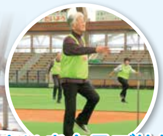
いきいきクラブ体操