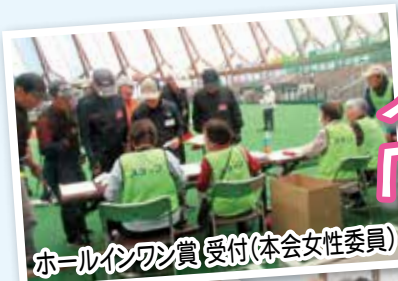
ホールインワン賞 受付(本会女性委員)