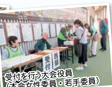
受付を行う大会役員 (本会女性委員・若手委員)