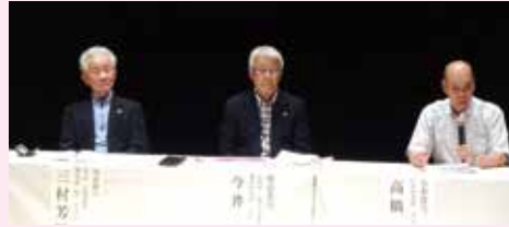
第3部「会員増強の取組と後継リーダーの育成」事例発表の様子