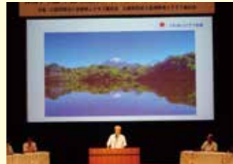
第2部「地域における支え合いと生活支援活動」事例発表の様子