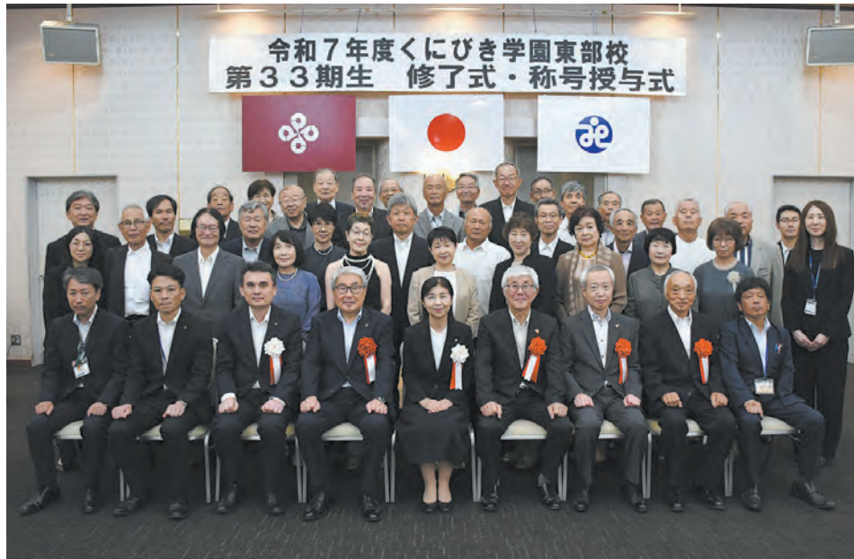
令和7年度くにびき学園東部校 第33期生 修了式・称号授与式

歴史探訪のフィールドワークで「黄泉の国の入り口」を訪ねたのが一番の思い出。仲間と学び、楽しい時間を過ごすことができました。今後は子ども食堂や高齢者支援に関わりながら、学園時代に始めた手話も学び続けたい。地域とのつながりを大切に、活動を広げていきたいです。