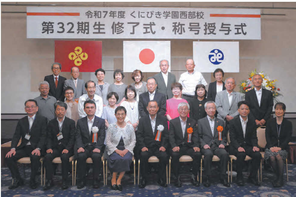
令和7年度くにびき学園西部校 第32期生 修了式・称号授与式