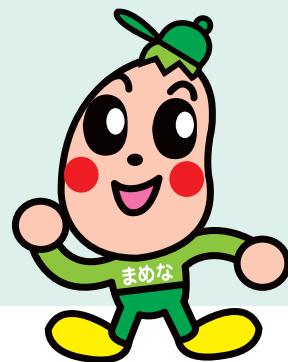
健康長寿しまねマスコットキャラクター「まめくん」