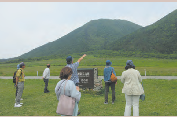
← 4面では「くにびき学園」の修了式の様子を紹介!