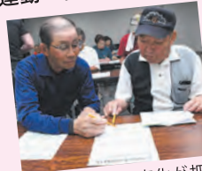
測定記録は経年変化が把握できる専用の手帳に記入

シニア世代の元気の秘訣は「体力の見える化+運動の習慣化」。毎日の積み重ねが重要です。