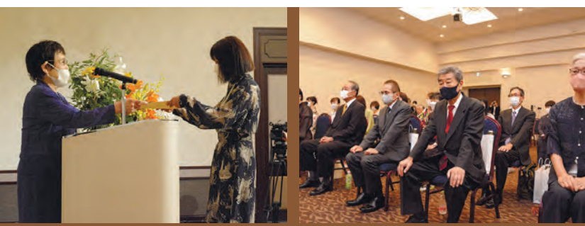
令和5年度 くにびき学園西部校 第30期生 修了式・称号授与式

「くにびき学園」東部校第31期生と西部校第30期生の修了式が7月下旬、松江、浜田両市で行われました。また、2021年9月から2年間、生きがいくくりと仲間づくりに取り組んできた計28人の修了生に加え、既に卒業している計23人に、今後地域の担い手として活躍が期待される「わが島根づくりマイスター」の称号が授与されました。