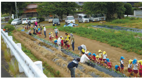
サツマイモの苗植えの様子

磁調理器の普及で火を見た ことがない子どもも少なくあり ません。そんな子どもたちに 昔ながらの遊びや体験を