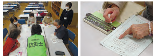
テーマに沿った学びを深める西部校生たち

浜田市野原町の「いわみーる」で開かれた西部校前期振り返り会では、31期生10人が三つのテーマに分かれて発表しました。授業で学んだ内容に加え、改めて調べたり、グループ内で話し合ったりした結果を模造紙にまとめて紹介。写真やグラフ、表なども活用し、分かりやすく伝えることに力を入れました。