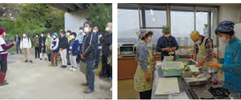
テーマに沿った現地学習などを行う東部校生たち