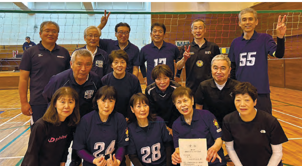
「松江カラコロ」チームの皆さん

「ねんりんピック」の愛称で親しまれている全国健康福祉祭は、60歳以上の方々を中心とするスポーツ、文化、健康と福祉の総合的な祭典で、シニア世代を中心とする県民の健康の保持・増進、社会参加、生きがいの高揚を図り、ふれあいと活力ある長寿社会を築くことを目的として開催されます。今年は10月に愛媛県で開催されます。