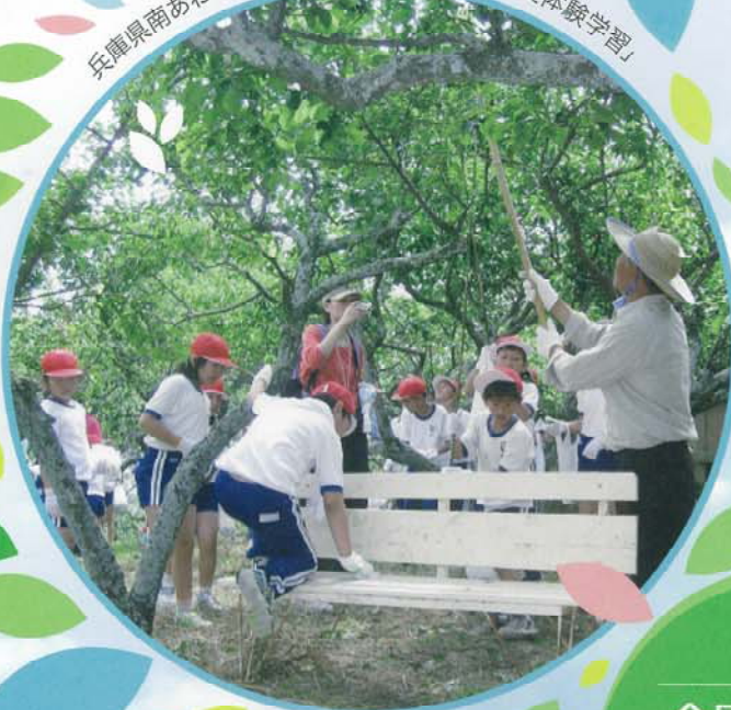
兵庫県南あわじ市 緑老人クラブ「梅の実収穫体験学習」