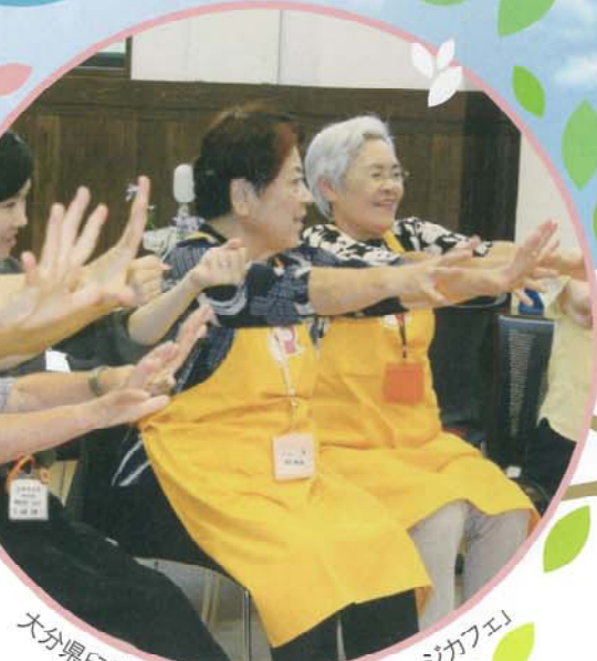
大分県臼杵市老連女性部「ほっとオレンジカフェ」