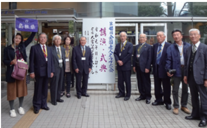
島根県参加者一同 於「大宮ソニックシティ」