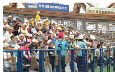
ゲーム開始前に選手集合・整列を促す (出雲市高連)