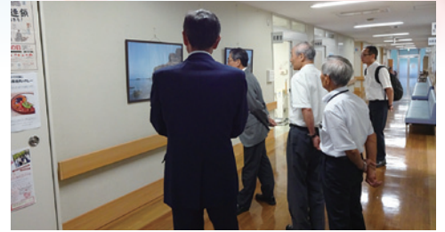
意見交換後、大雅クラブ写真同好会(西ノ島町)の作品を見学(写真展示:隠岐島前病院)

また、本会の今後の事業展開についてご要望等いただく機会となり、有意義な意見交換会となりました。