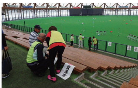
大勢の選手・応援者を迎える準備 (本会若手・女性委員)