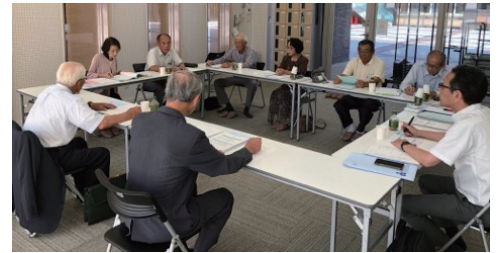
地域意見交換会の様子(江津市)