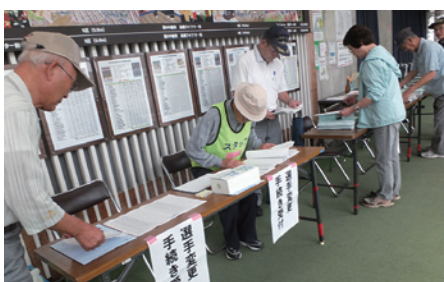
受付の準備 (本会若手・女性委員)