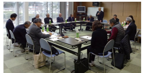
地域意見交換会の様子(雲南市)