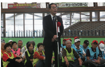
島根県議会議長 中村 芳信 氏あいさつ