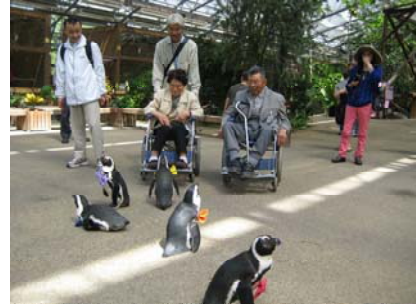
【 交流会の様子 】

孤独になりがちな高齢者が、いつでも支援をしてもらえることの安心感、支援を終えた時の協力会員の達成感と利用会員との信頼関係が地域の活性化につながっている。